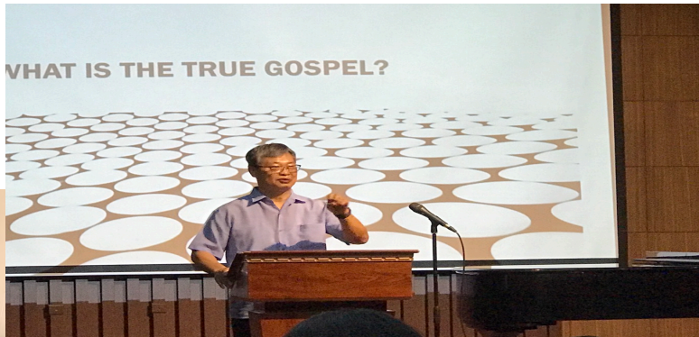
(매주 수요일 채플에서 설교)