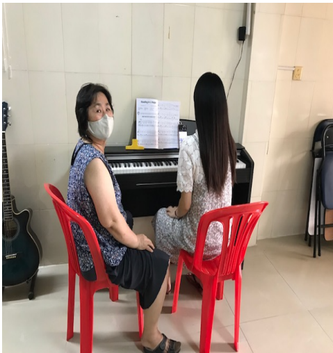
(피아노 레슨 중)