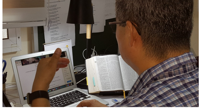
(Zoom 강의 중에)

뿐만 아니라 캄보디아와 미얀마 그리고 동남아 지역에 복음의 일군을 많이 세워서 하나님의 나라가 확장되도록 기도해 주시기 바랍니다.