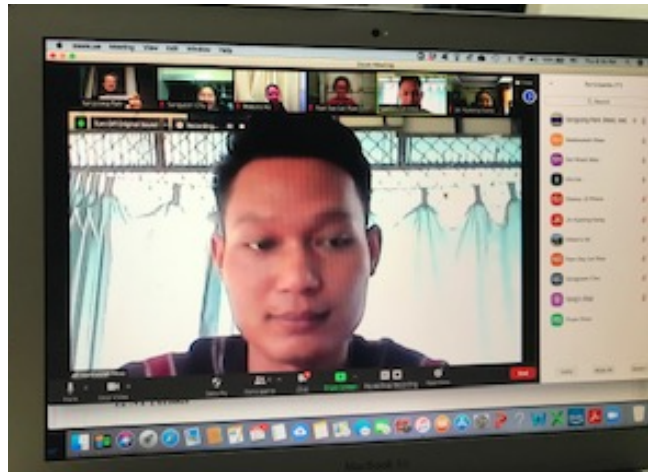
(MDiv 학생들 강의 시간에)