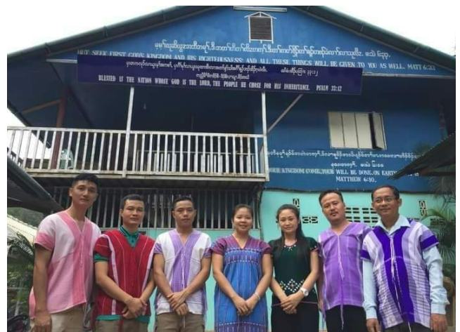
(Diaspora 신학교 미얀마 학생들 )